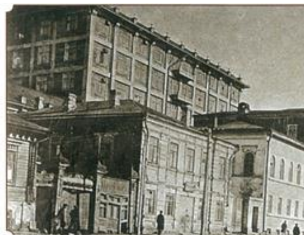
Здание института на ул. М. Горького