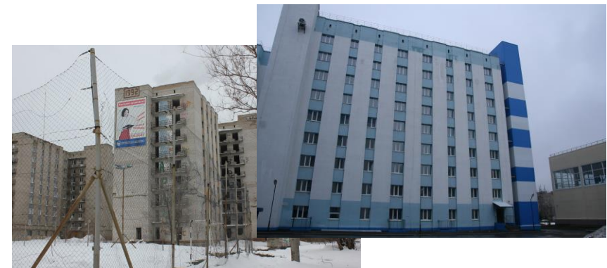
Общежитие, ул. Блюхера, 23А 4/3 завершение строительства