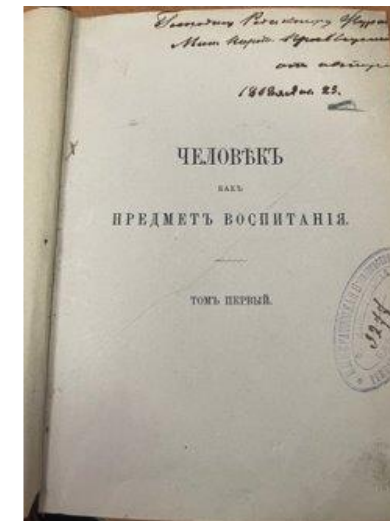
Прижизненное издание К.Д. Ушинского с автографом автора

Библиотека предоставляет неограниченный доступ к российским и зарубежным базам данных и электронно-библиотечной системе: