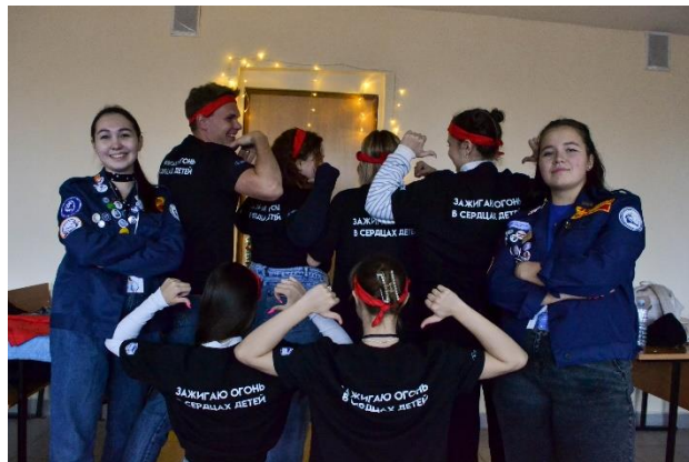
Победа областном конкурсе «Лучший студенческий совет общежития вуза»

Обучено 670 специалистов в рамках программы профессионального обучения по квалификации «Вожатый». Обучение реализована при грантовой поддержке Молодежной общероссийской организации «Российские студенческие отряды»