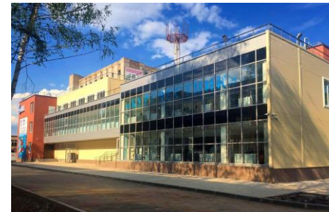
ФОК «Буревестник» с плавательным бассейном, строительство