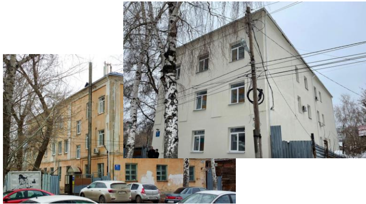
Учебный корпус № 7, ул. Пушкина, 248, ремонт

В СГСПУ 10 учебных корпусов, 66 лабораторий, более 200 учебных аудиторий, 9 спортивных залов, футбольное поле, физкультурно-оздоровительный комплекс «Буревестник» с плавательным бассейном.