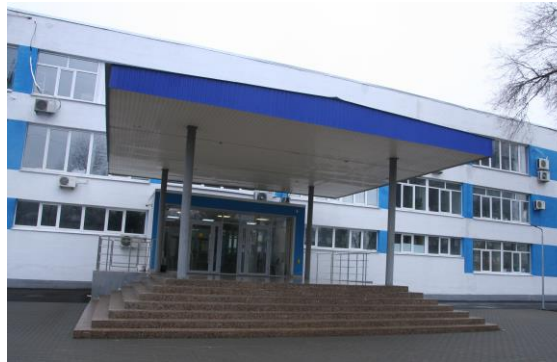
Учебный корпус № 9, ул. Антонова-Овсеенко, 24, ремонт